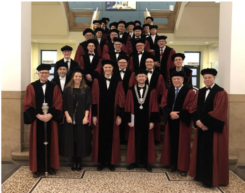
Maastricht, 29 november 2019

Redactie Filip Batsel  Laura Mortiers Pieterjan Schepens Sebastiaan Vandenbogaerde Florenz Volkaert